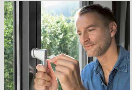
Wird ein Fenstergriff abgeschlossen, wird es Einbrechern erschwert, nach Glasbruch den Griff von außen zu betätigen.